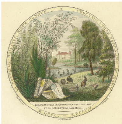
Frontispice de l'ouvrage Voyage de découvertes aux Terres Australes écrit par François Péron et illustré par Charles-Alexandre Lesueur, 1807-1816