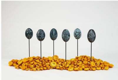
Jonathan Jones sans titre (territoire Eora) / untitled (emu eggs) , 2021 d'après Étienne-Pierre Ventenat Coquille d'œuf d'émou (Dromaius novaehollandiae) ; Fleur d'immortelle à bractées (Bracteantha xerochrysum)

Photos HD sur demande : sophie.chirico@culture.gouv.fr