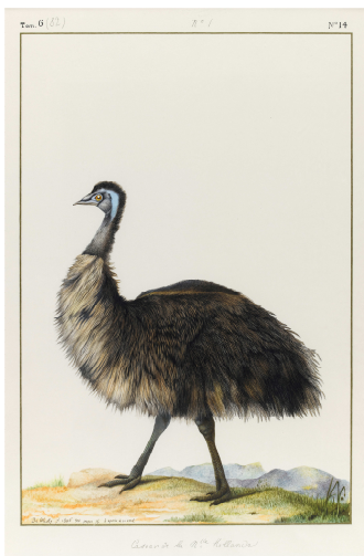
Casuar de la Nouvelle-Hollande