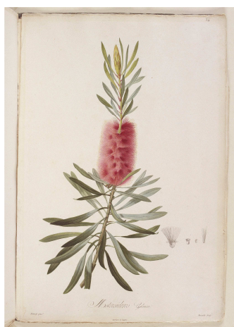
Planche extraite de l'ouvrage Description des plantes rares cultivées à Malmaison et à Navarre écrit par Aimé Bonpland (1773-1858)

https://photo.rmn.fr/archive/99-022107-2C6NU0XRJU94.html