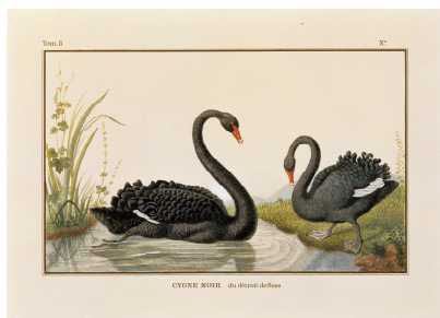
Cygne noir du détroit de Bass

Aquarelle de Pierre Dandelot (1910-2007) d'après Pierre-François de Wailly (1775-1852)